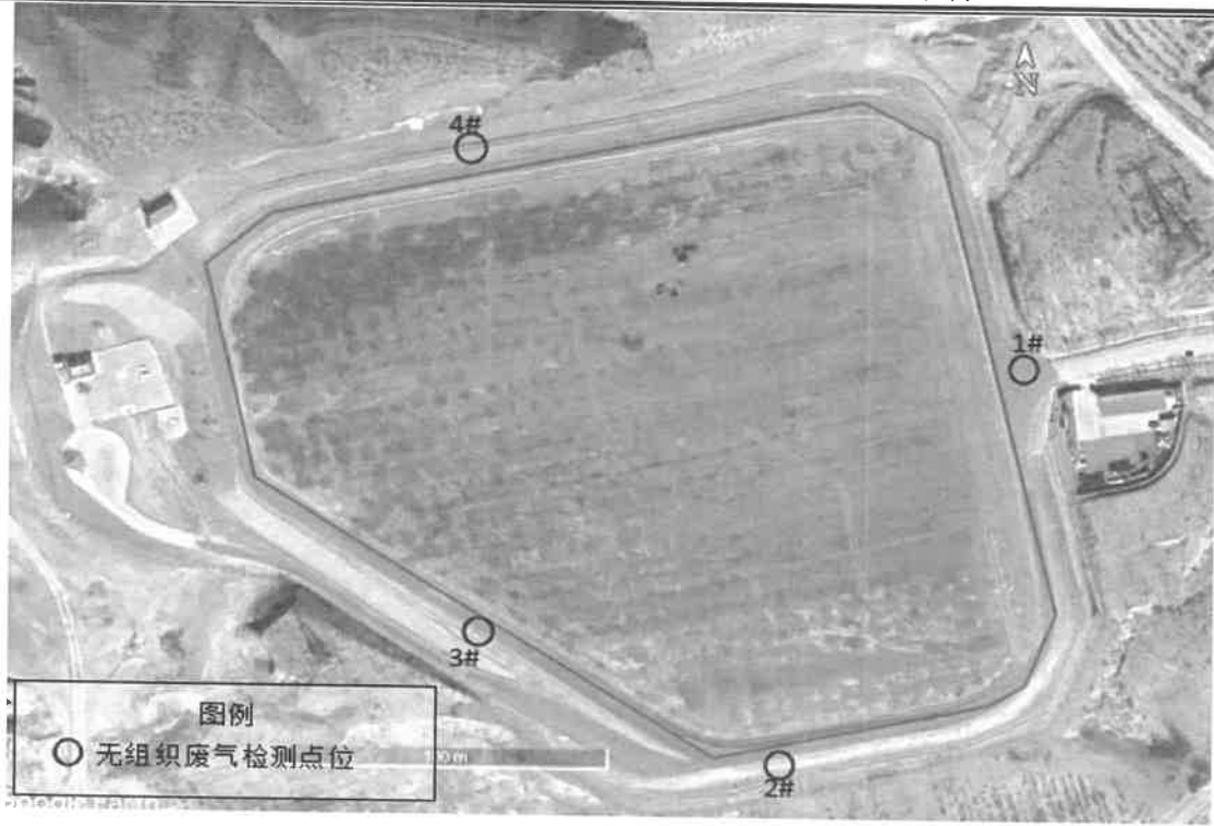
图 1 无组织废气检测点位示意图