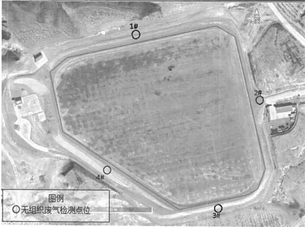
图 1 无组织废气检测点位示意图