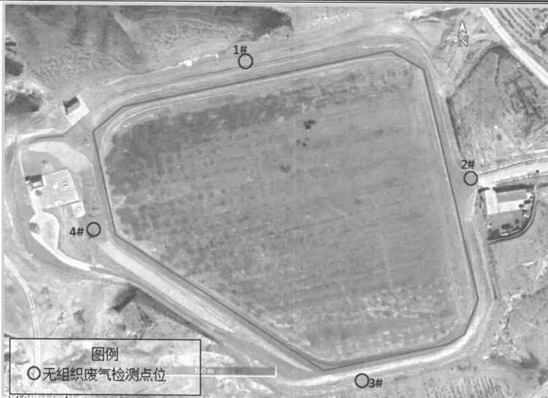
图 1 无组织废气检测点位示意图