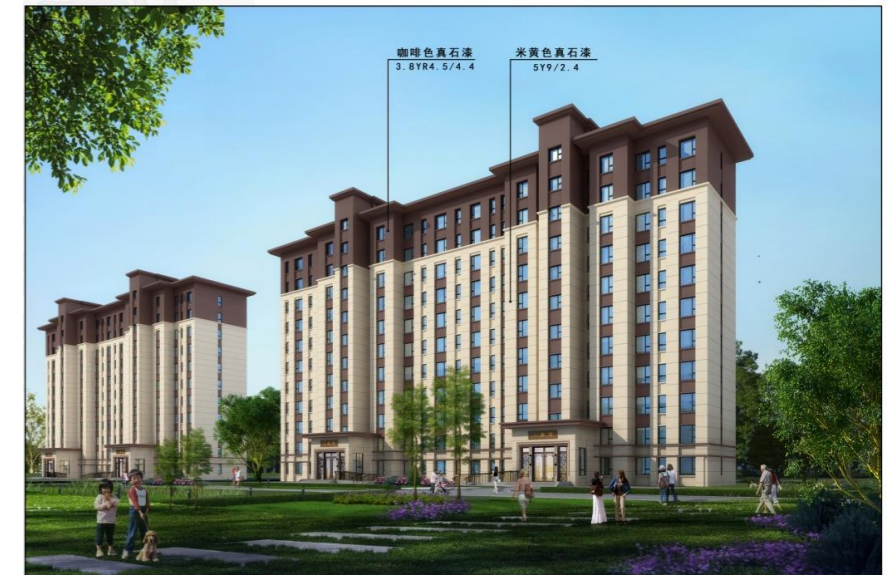
住宅南立面效果图