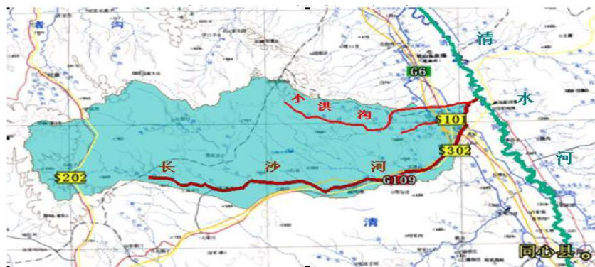
图3-6 沟道治理水系图

河道内由于前几年无序采砂，生态系统破坏严重，沟道内残留矿坑较多、坑洼不平，植被稀少，岸坡陡峭；为干沟，常年无水。沟道治理水系图见下图。